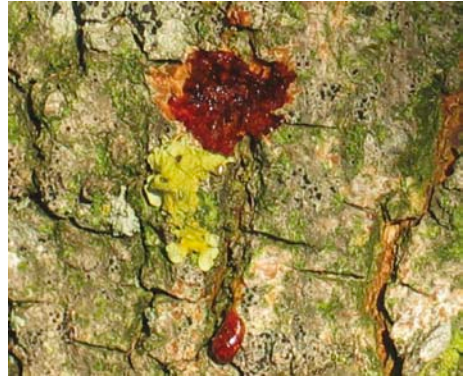
Saftfluss an Eiablagestelle