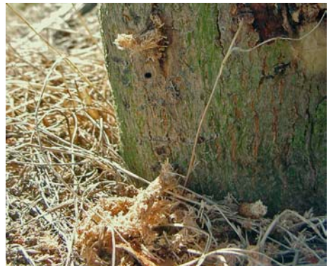
Bohrspäne unter dem Ausbohrloch