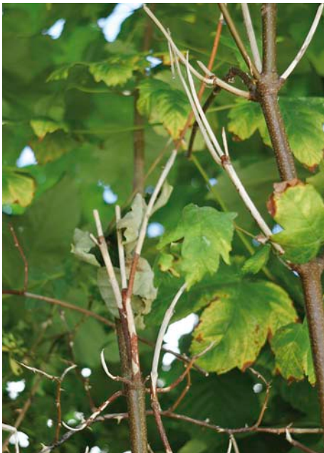
Reifungsfrass-Spuren der erwachsenen Käfer an dünnen Ästen

Der Asiatische Laubholzbockkäfer befällt verschiedenste Laubholzarten – auch gesunde Bäume. Er kann sie binnen weniger Jahre zum Absterben bringen. Die wirtschaftlichen Schäden für die betroffenen Gebiete sind sehr hoch. Denn: Befallene Bäume müssen gefällt und verbrannt werden. Die Fällung benachbarter potenzieller Wirtsbäume kann ebenfalls notwendig sein und angeordnet werden. Die Gefahr besteht, dass der Asiatische Laubholzbockkäfer auch im Wald grosse wirtschaftliche und ökologische Schäden anrichtet.